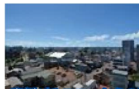
南側バルコニーからの眺望

価格改定!未入居物件!新幹線乗り口まで歩いてらくらくのアーバンライフ! リビングには、温水ルームヒーター&床暖房!